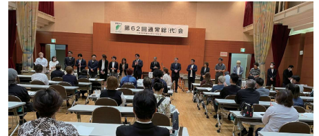
< 新体制となった理事の皆さん >