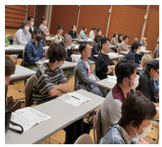
< 総代の皆さん >